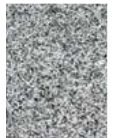
Padang (kiinalainen graniitti)