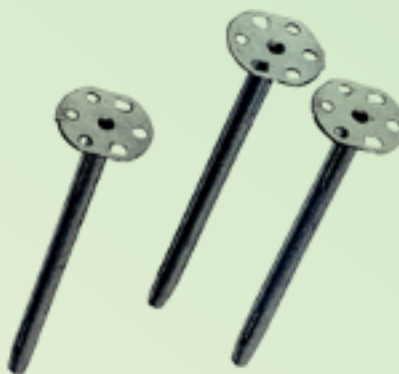
PCI PowerBoard -metalliankkurit