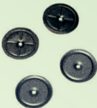
PCI PowerBoard -aluslevyt