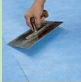
Paina mattoa esim. lastalla tai kumitelalla.