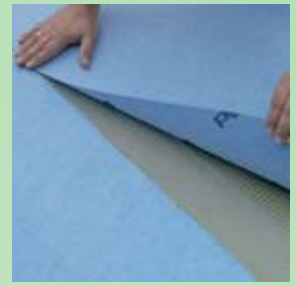
Kiinnitä matto paikoilleen massan avoimena aikana.