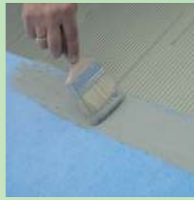
Levitä huolellisesti PCI Seccoral 1K/2K Rapid -liimaa PCI Pecilastic W -maton reunalle tehdäkseen vesitiiviin limisauman.

Pitkät, liikkuvat halkeamat tasoitteessa tai betonissa on sidottava paikoilleen ruiskuttamalla niihin PCI Apogel F -hartsia. Hiushalkeamat eivät vaadi erityiskäsittelyä.